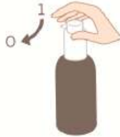
Saat yönünde (kilitli durum)

Dozlama pompasının başı kilitli pozisyonda iken aşağı bastırılmamalıdır. Çözelti sadece açık pozisyonda iken alınabilir. Bunu yapmak için, dozlama pompasının başı direnç hissedilinceye kadar, ok yönünde yaklaşık sekizde bir dönüş kadar çevrilmelidir (Şekil 1).